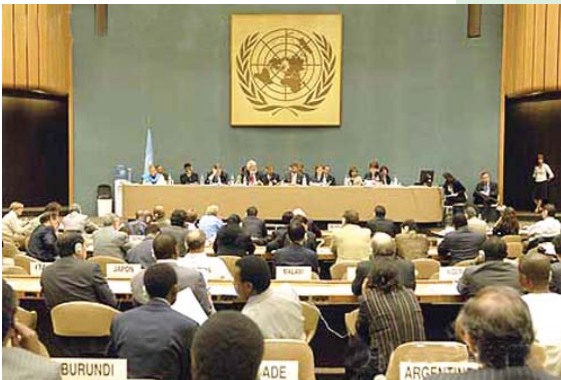
अन्तर्राष्ट्रिय श्रम संगठनको सर्वोच्च सञ्चालक निकाय (Governing body) बैठक, १५ जुन २००७