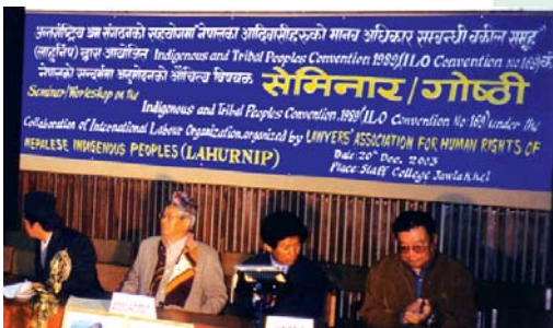
लाहूर्निपको आयोजनामा अन्तर्राष्ट्रिय श्रम संगठन महासन्धि नं. १६९ अनुमोदनको औचित्यबारे नेपालमा गरिएको पहिलो कार्यक्रम

यी सबै कार्यक्रमहरूका साथै आदिवासी/जनजातिहरूका लागि केही अन्य परियोजनाहरू पनि सञ्चालनमा छन्। यी परियोजनाहरू बोलिभिया, मध्यअमेरिका तथा पेरूको अमेजन क्षेत्रलगायतमा सञ्चालन भइरहेका छन्।