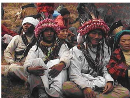
कुलुड नाक्छोडहरू परम्परागत उपचार पनि गर्छन्

“उनीहरूमा वाल मृत्युदर गैरआदिवासीहरूभन्दा बढी छ, बाँच्ने आयु थोरै छ र उनीहरू रोगहरूबाट बढी प्रभावित छन्।” ६२