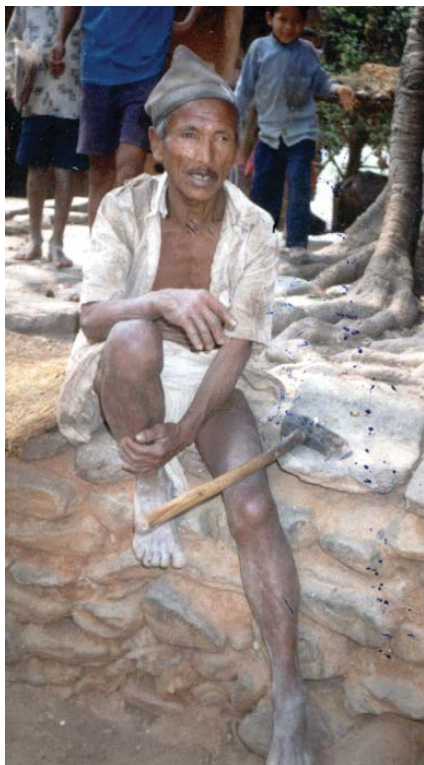
आदिवासी वृद्ध वृद्धाहरू सामाजिक सुरक्षाको आशामा

सामाजिक सुरक्षाका व्यवस्थाहरू सम्बन्धित समूहहरूलाई सम्बोधन गर्न क्रमिकरूपमा विस्तार गरिनेछ, र सो सेवा बिनाभेदभाव उनीहरूमा लागू गरिनेछ।