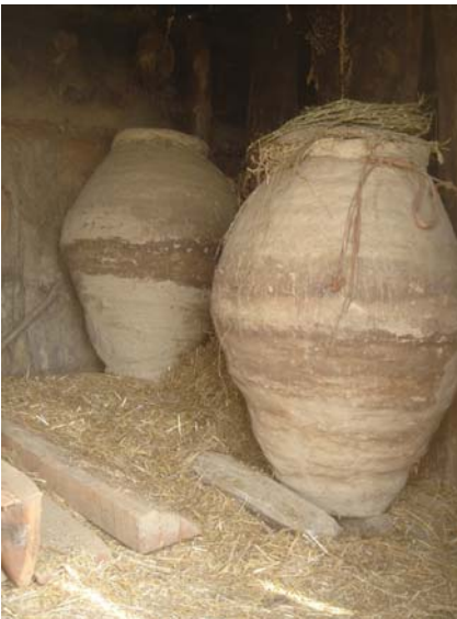
अन्न सुरक्षा गर्ने आदिवासी प्रविधि