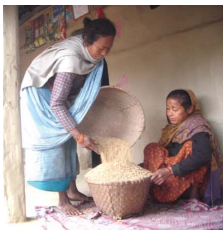
आदिवासीहरूको प्रथा परम्परामा आधारित जीवन पद्धति : थारू महिलालाई माछा दिएर धान लिँदै बोटे महिला

आदिवासी/जनजातिहरूको छुट्टै संस्कृति तथा परम्पराहरूको देख्न सकिने अभिव्यक्तिको रूपमा उनीहरूको भेषभूषालाई लिन सकिन्छ, जुन अन्य राष्ट्रिय समुदायहरूभन्दा प्रायजसो फरक हुन्छ, र जसलाई उपलब्ध प्राकृतिक स्रोतहरूको उपयोग गरेर तयार गरिन्छ। उदाहरणको रूपमा इन्विट आदिवासीले प्रयोग गर्ने शीलको छाला, सामी आदिवासीले प्रयोग गर्ने हरिण (रेनडियर) को छाला तथा भुत्ला र बोलिभिया, लाओ तथा थाइलैण्डका आदिवासी/जनजातिहरूले प्रयोग गर्ने घरबुना कपडा रहेका छन्।