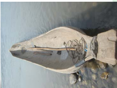
एउटै रूखबाट हुड्गा बनाउने आदिवासी प्रविधि

कुनै पनि विशेष तालिम कार्यक्रम सम्बन्धित समूहहरूको आर्थिक, वातावरणीय, सामाजिक तथा सांस्कृतिक अवस्था एवं व्यवहारिक आवश्यकताहरूमा आधारित हुनेछ। यस सम्बन्धमा गरिने कुनै पनि अध्ययन सम्बन्धित समूहको सहयोगमा गरिनेछ, र सो समूहसँग त्यस्ता कार्यक्रमको संगठन तथा कार्यान्वयनका बारेमा परामर्श गरिनेछ। सम्भव भएसम्म र यी समूहहरूले चाहेमा त्यस्ता तालिम कार्यक्रमहरूको संगठन तथा सञ्चालनको जिम्मेवारी विस्तारै ती समूहहरूले नै लिनेछन्।