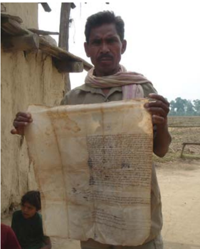
भूमि तथा प्राकृतिक स्रोतमाथि राजीको अधिकार रहेको दस्तावेज देखाउँदै कैलाली जर्का राजी

सम्बन्धित समूहले गर्ने भूमिमाथिको दावीलाई समाधान गर्न राष्ट्रिय कानूनी पद्धतिअन्तर्गत पर्याप्त प्रक्रियाहरूको स्थापना गरिनेछ।