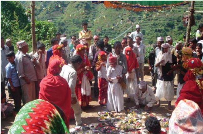
परम्परागत संस्कृतिमा रम्दै कुलेखानीका तामाडहरू

महासन्धि नं. १६९ ले सरकारहरूले आदिवासी/जनजातिहरूको प्रथा तथा परम्पराहरूलाई संरक्षण गर्न विशेष उपायहरू अवलम्बन गर्नेछन् भनेर उल्लेख गरेको छ। यो यस धर्तीको सम्पन्न सांस्कृतिक विविधतालाई बल पुऱ्याउन हो।