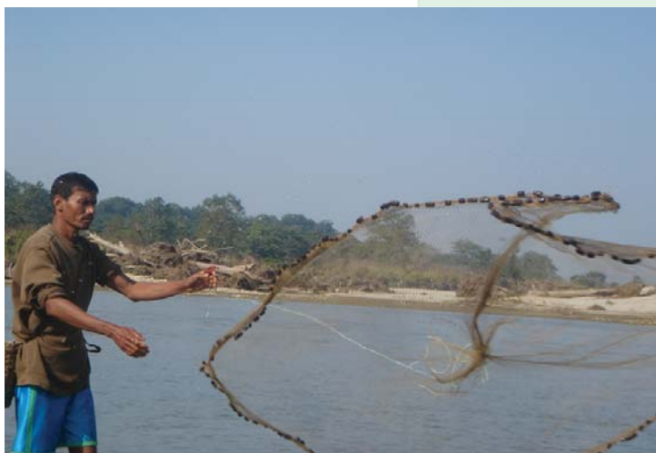
परम्परागतरूपमा माछा मार्न छेक्दै न माफि, राजी र बोटेहरूलाई राज्यको सीमानाले

यसका साथै, राष्ट्रिय सिमानाद्वारा विभाजित धेरै आदिवासीहरूको आफ्नै अन्तर्देशीय संगठनहरू छन्। यस्ता संगठनहरूमा इन्विट ध्रुवीय सम्मेलन (ICC), सामी परिषद्, थाइल्याण्डको अन्तरपर्वतीय समूहहरूको शिक्षा तथा संस्कृतिसंग सम्बन्धित संघ (IMPECT) र दक्षिण अमेरिकाको आदिवासीहरूको संगठन (COICA) लगायत छन्।