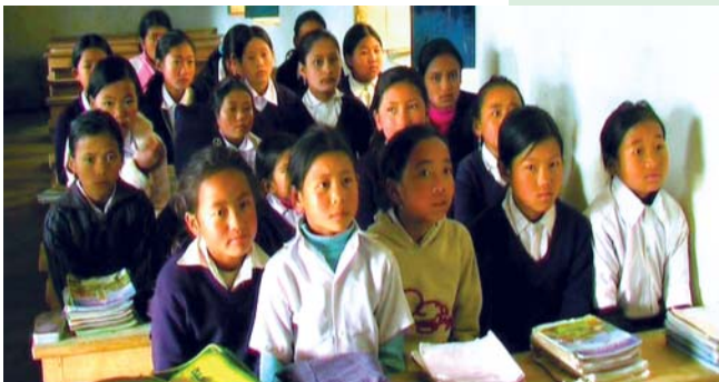
मातृ भाषा अध्ययन गर्दै धनकुटाका आदिवासी/जनजाति विद्यार्थीहरू