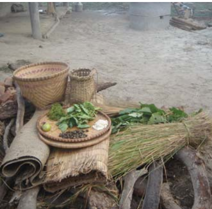
जीविका उपार्जनको लागि जंगलबाट प्राप्त सामग्रीहरू

सम्बन्धित समूहहरूको भूमिमा रहेको प्राकृतिक स्रोतहरूमाथिको उनीहरूको अधिकारलाई विशेषरूपले संरक्षित गरिनेछ। यो अधिकार अन्तर्गत त्यस्ता स्रोतहरूको प्रयोग, व्यवस्थापन तथा संरक्षणमा ती समूहहरूको सहभागी हुने अधिकार पर्दछ।