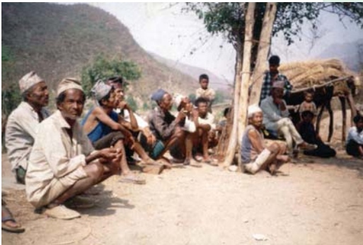
छलफलमा व्यस्त माफ्तीहरू

यसैले कुनै पनि आदिवासी/जनजातिहरूलाई प्रत्यक्ष असर पार्ने कानूनहरू वा प्रशासनिक प्रावधानहरूलाई लागू गर्दा सरकारहरूले ती समूहहरूसँग खुल्ला, स्पष्ट तथा अर्थपूर्ण छलफलहरू गर्नुपर्दछ।